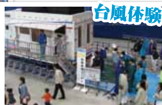
強風・大雨を実際に体験